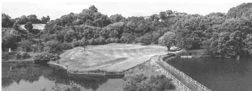
セカンド地点からグリーンを望む